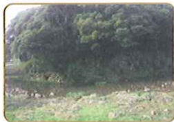
鯉鉾池 (しゃちほこいけ)