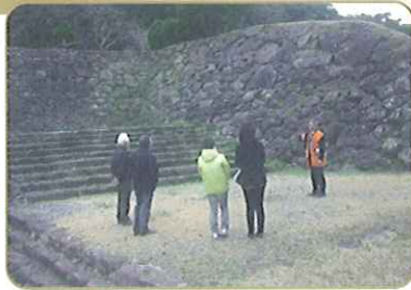
山里口(やまざとぐち)