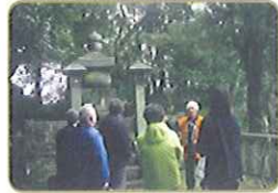
太閤遺髪塚 (たいこういはつづか)