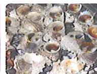
サザエのつぼ焼き(波戸岬)