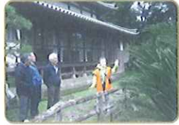
広沢寺(こうたくじ)