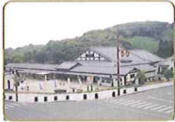
桃山天下市 (集合・ゴール)