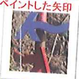
カンセ (馬の頭が進行方向)