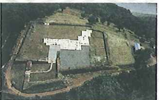
도요토미 히데야스의 진영터(특별사적)