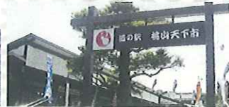
미치노에키 모모야마텐카이치 TEL 0955-51-1051