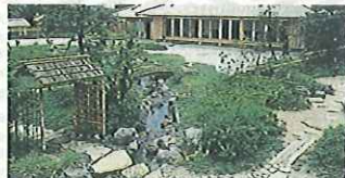
찾집 [가이게쓰] TEL 0955-82-4384