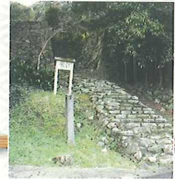
야마자토마루로 가는 석단 소로리 신자에몬의 설계로 알려져 있다.