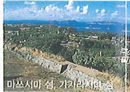
마쓰시마 섬, 가라쓰시마 섬