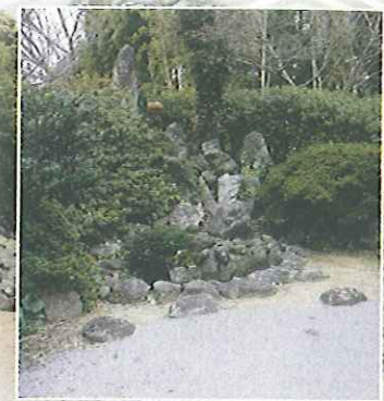
호코지(法光寺) 정원 경내에는 다이코 히데요시가 직접 심었다는 벚꽃이 있다.