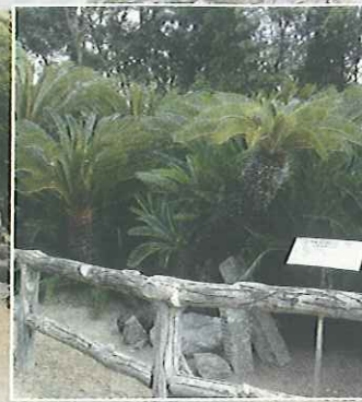
고타쿠지(広沢寺)의 큰 소철 (천연기념물)