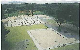
호리 히데하루의 진영터(특별사적)