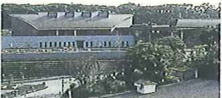
사가현립 나고야성 박물관 TEL 0955-82-4905